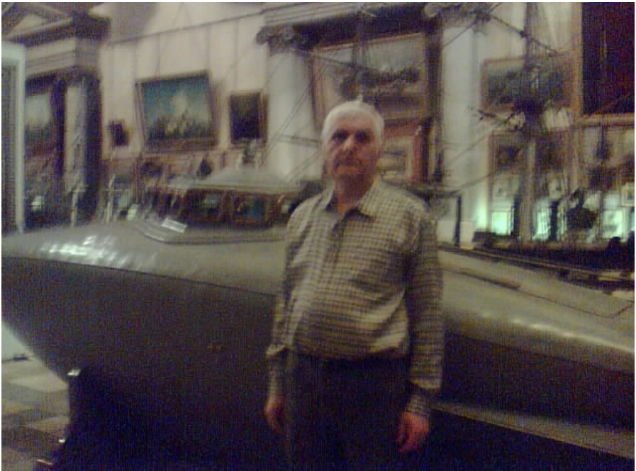
Рис. 2 Підводний човен С. К. Джевецького моделі 3. Центральний музей ВМФ РФ, Санкт-Петербург.

Головний підводний апарат Джевецького цієї серії проходив іспити у Воєнній гавані з 15 травня по 30 серпня 1882 року під орудою лейтенанта І. І. Чайківського (8[20].04.1843-1927, брат відомого композитора) й за 57 ходових діб протримався під водою 96 годин. В подальшому цим апаратом успішно командував підпоручник Гросс.