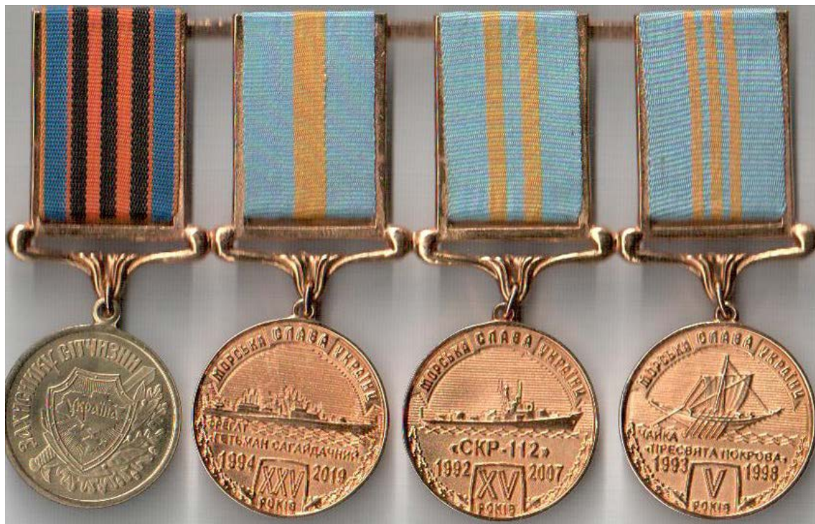
Рис. 7. Медалі «Захисник Вітчизни» та «Морська слава України»

Наступний проект «Морська слава України» (див. рис. 6 – 7) був запроваджений «Братством моряків України» (президент – контр-адмірал Микола Костров), виконаний у двосторонньому варіанті (аверс і реверс) трьох ступенів, що дало змогу поєднати дати визначних перемог над трьома імперіями (Римською, Візантійською, Османською) прадавніх українських флотів (Античного, Княжого, Козацького) із славетними звитягами відроджених Військово-Морських сил України, а саме океанськими походами фрегата «Гетьман Сагайдачний», проривом СКР-112, попри збройну протидію «каساتонівських» кораблів, плаванням сучасної козацької чайки «Пресвята Покрова» впродовж 15 кампаній у навколишніх європейських морях та безпосередньо в Атлантичному океані. Нагорода також має статут [12, 206 – 207, 313 – 315; 13].