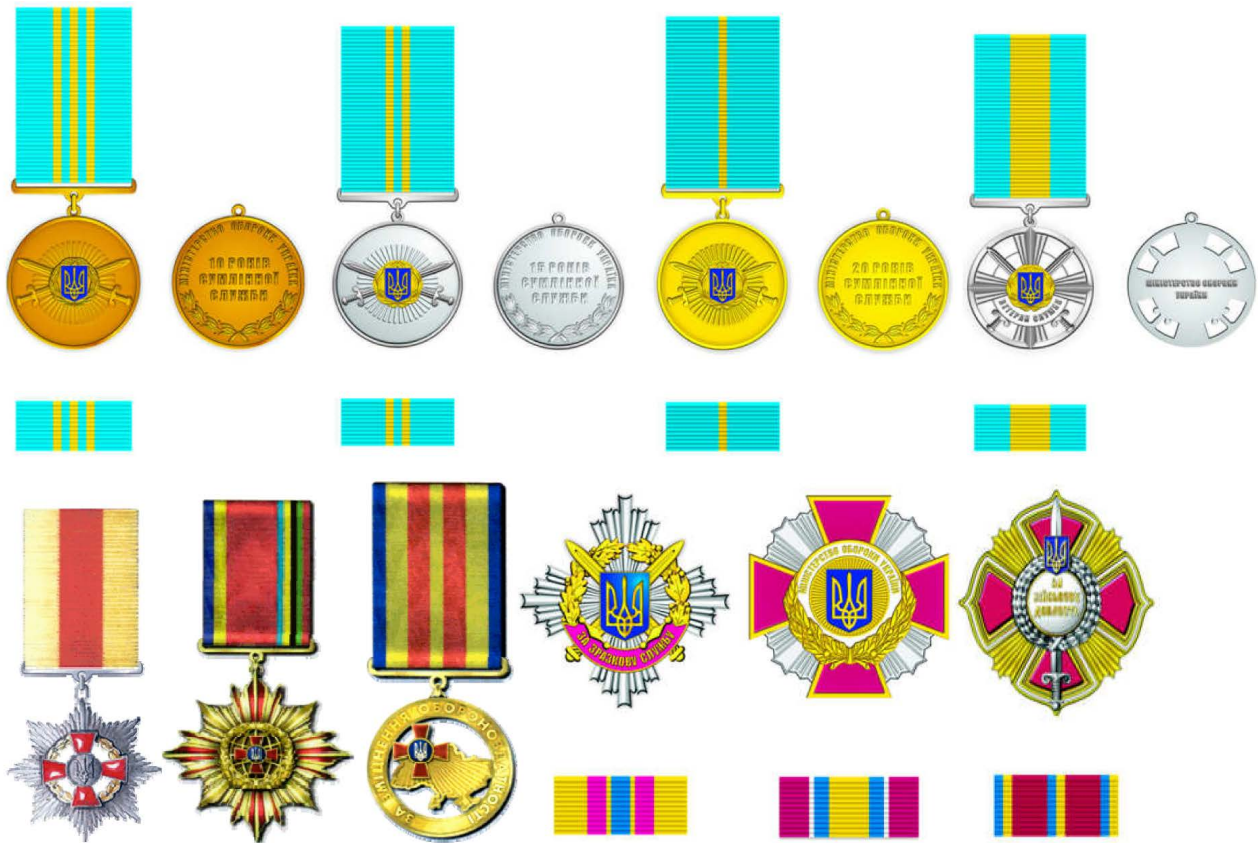
Рис. 4. Сучасні відзнаки Міністерства оборони України

Виняткове місце належить медалі «Захиснику України», у якій, на відміну від президентської нагороди «Захиснику Вітчизни», врахована і міфологічна історія, і сучасність (див. рис. 5).