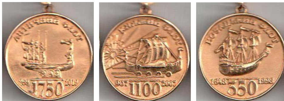
Рис.8. Медаль «Морська слава України» (реверс) Зліва направо: 1 ступінь, 2 ступінь, 3 ступінь

Наступний проект «Морська слава України» (див. рис. 6 – 7) був запроваджений «Братством моряків України» (президент – контр-адмірал Микола Костров), виконаний у двосторонньому варіанті (аверс і реверс) трьох ступенів, що дало змогу поєднати дати визначних перемог над трьома імперіями (Римською, Візантійською, Османською) прадавніх українських флотів (Античного, Княжого, Козацького) із славетними звитягами відроджених Військово-Морських сил України, а саме океанськими походами фрегата «Гетьман Сагайдачний», проривом СКР-112, попри збройну протидію «каساتонівських» кораблів, плаванням сучасної козацької чайки «Пресвята Покрова» впродовж 15 кампаній у навколишніх європейських морях та безпосередньо в Атлантичному океані. Нагорода також має статут [12, 206 – 207, 313 – 315; 13].