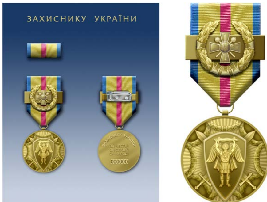
Рис. 5. Медаль МОУ «Захиснику України»

Виняткове місце належить медалі «Захиснику України», у якій, на відміну від президентської нагороди «Захиснику Вітчизни», врахована і міфологічна історія, і сучасність (див. рис. 5).