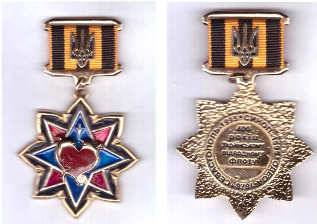
Рис. 6. Орден «Зірка Командора»