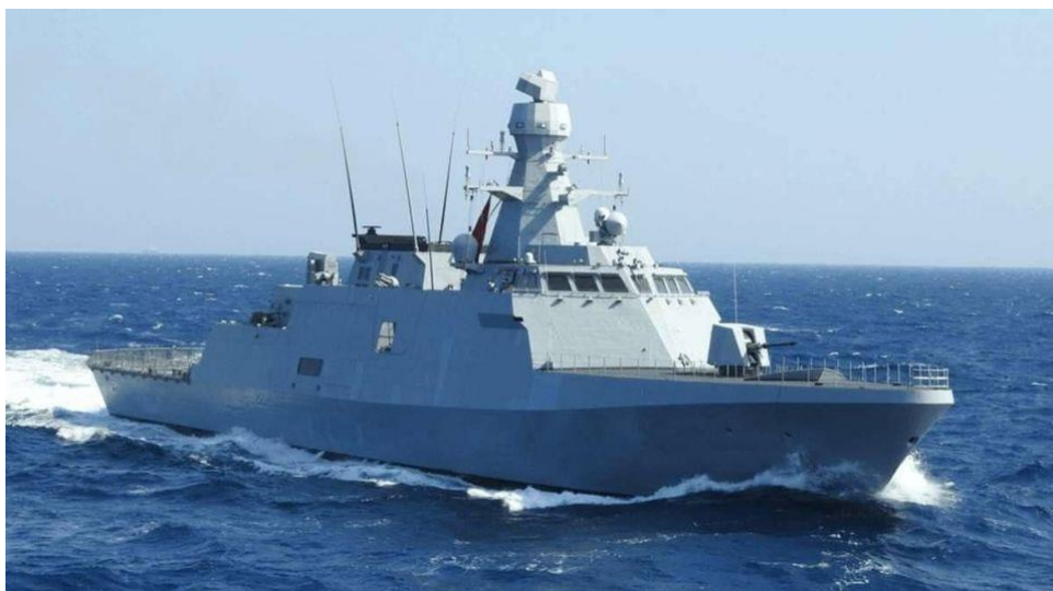
Рис. Корвет класу «Ада» для ВМС України

18.08.2022 Указом Президента України № 586/2022 першому корвету типу «Ада», що будується на турецьких верфях, присвоєно назву «Гетьман Іван Мазепа» [8].