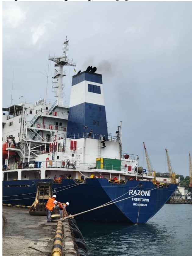
Рис.1 В одеському МТП під завантаженням.

1.08.2022 о 09.35 перше судно з українським зерном покинуло порт Одеса, скориставшись «зерновим коридором» [1].