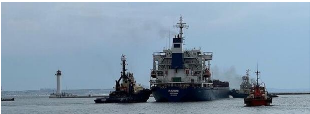
Рис.2 Перше судно з зерном покидає Одеський МТП.

Внаслідок систематичних підривів українських плавзасобів у гирлі Бистре р. Дунай судовий шлях цим маршрутом тимчасово призупинено [2].